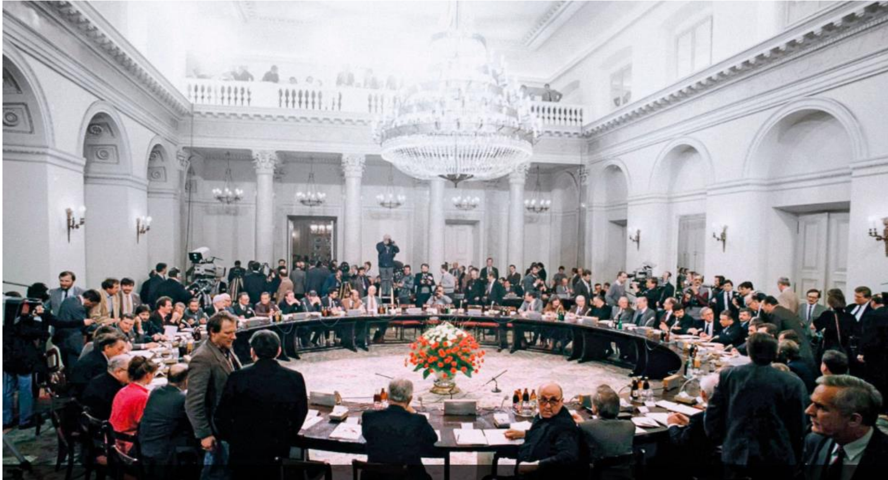
Rozmowy Okrągłego Stołu w Warszawie, 6 lutego 1989 roku.