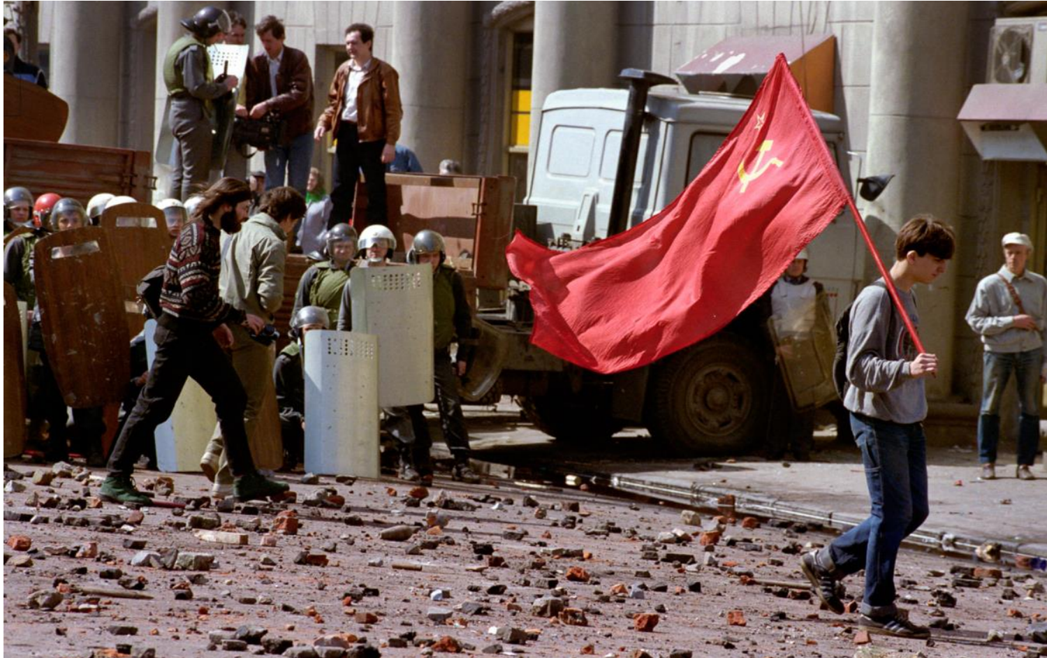
Rosja w okresie przejściowym lat 90. Demonstrant komunistyczny opuszcza miejsce po gwałtownym starciu z policją w Moskwie.