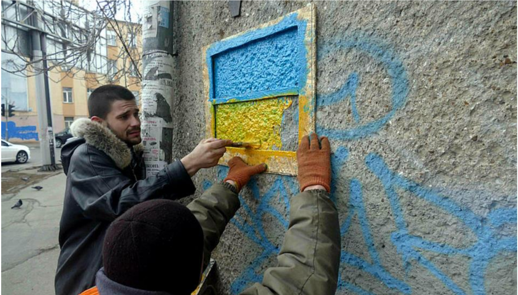
Pracownicy służb miejskich malują flagę Ukrainy na ścianie mieszkalnego budynku w Odessie.