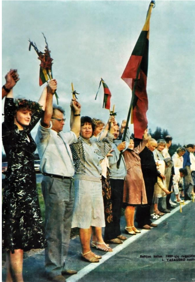
Zdjęcie Bałtyckiej Drogi opublikowane w czasopiśmie "Moteris". Uczestnicy trzymają świece oraz litewskie flagi z czarnymi wstążkami, wyrażając żalobę i niezgodę na panującą sytuację.