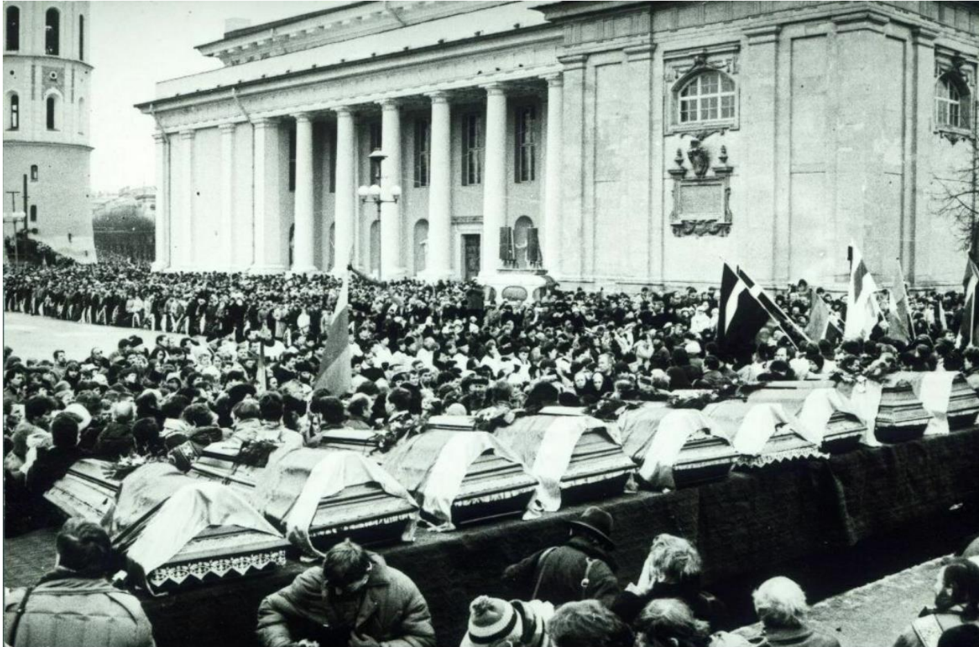
Ceremonia pogrzebowa dla Litwinów zabitych przez Armię Radziecką podczas ataku na obrońców litewskiej niepodległości 13 stycznia 1991 roku w Wilnie, na Litwie.