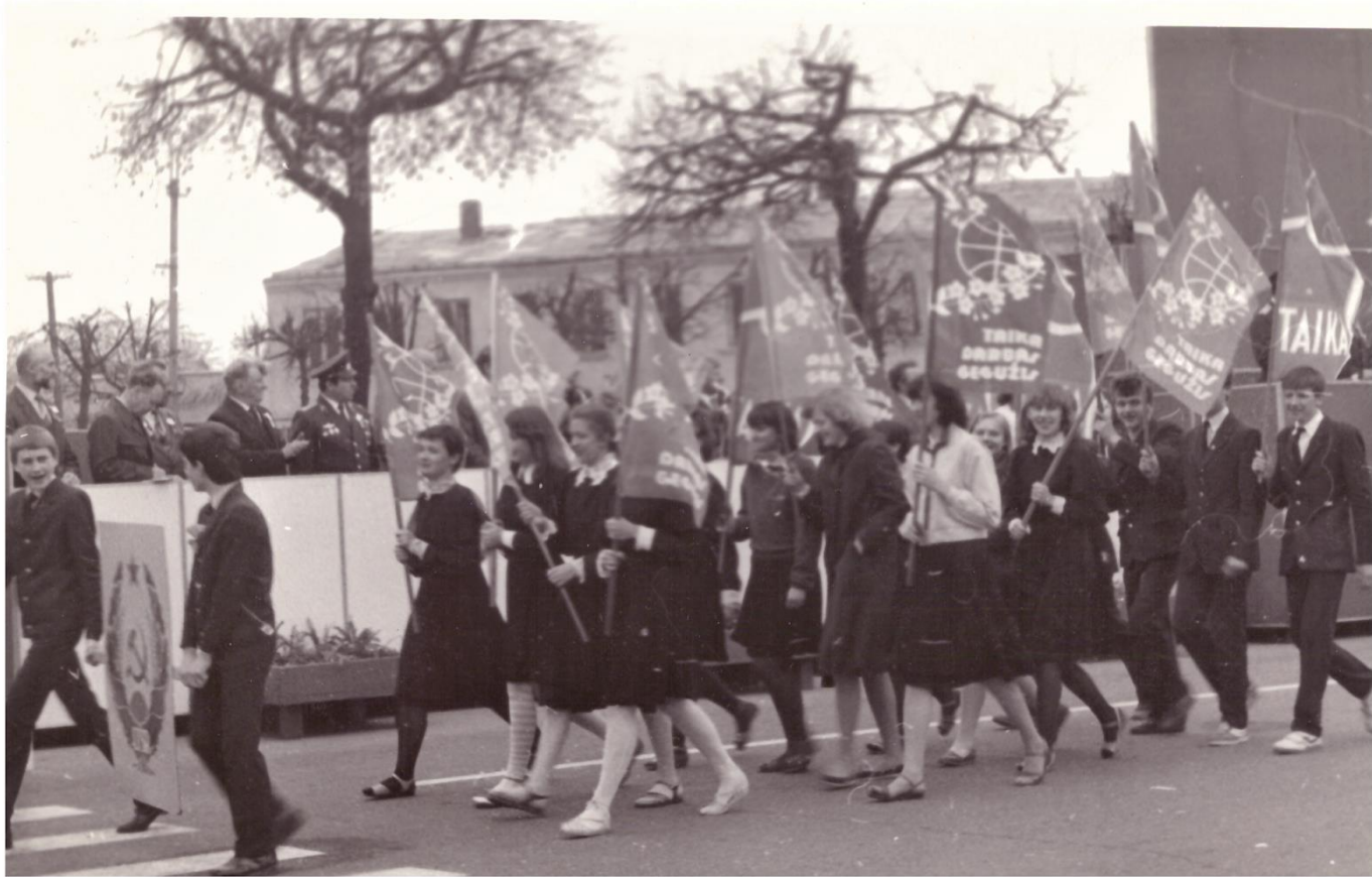
Litwa - Parada młodzieży.