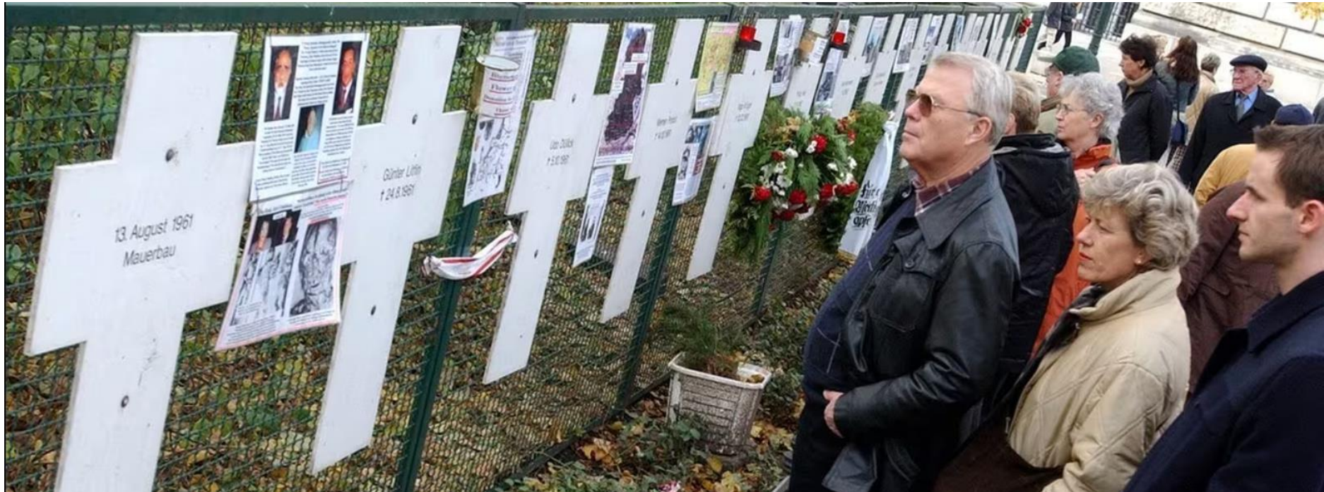
Wydarzenie upamiętniające osoby, które straciły życie przy Murze Berlińskim między 1961 a 1989 rokiem.