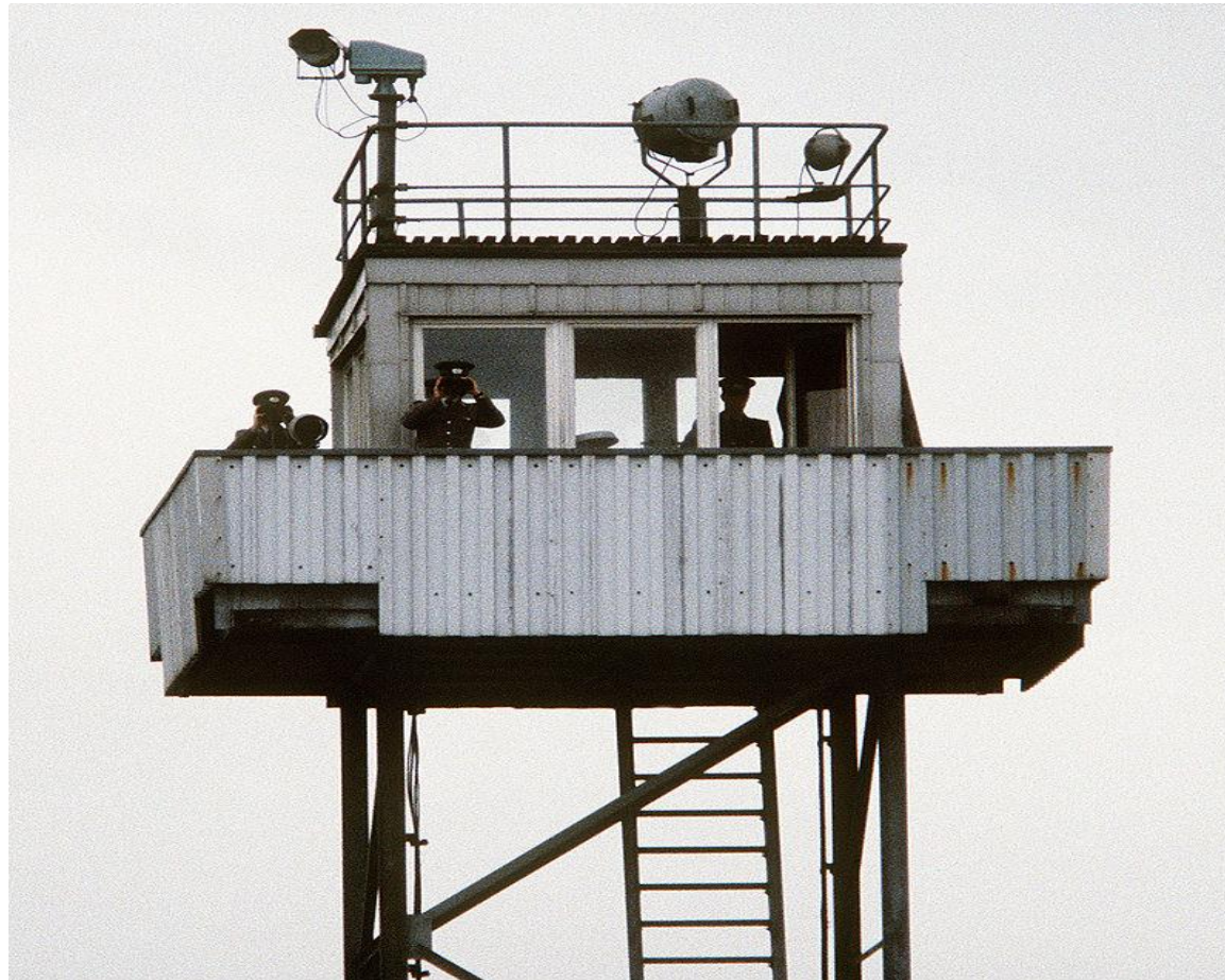
Niemieccy strażnicy graniczni na wieży obserwacyjnej przy wewnętrznej granicy w 1984 roku.