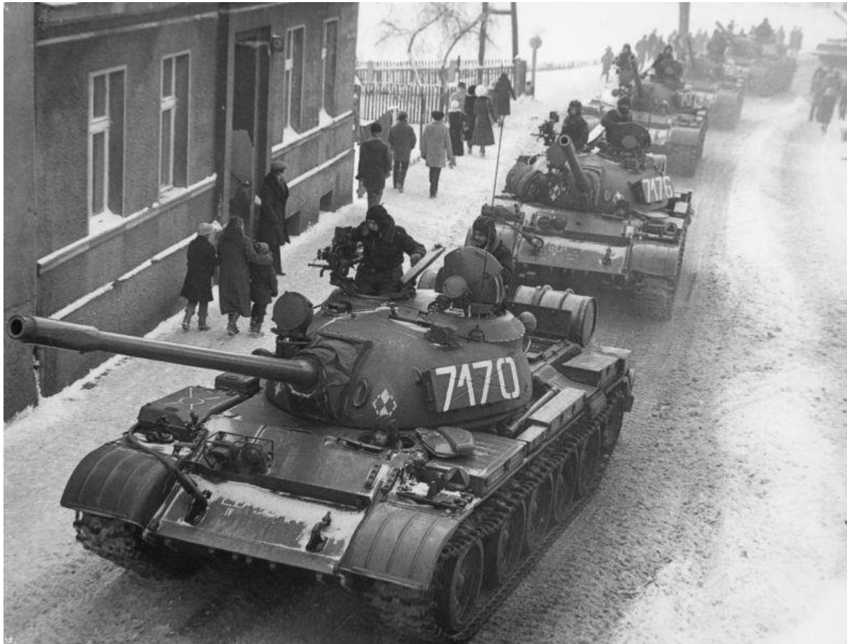
Czołgi T-55 na ulicach Zbąszynia podczas stanu wojennego.