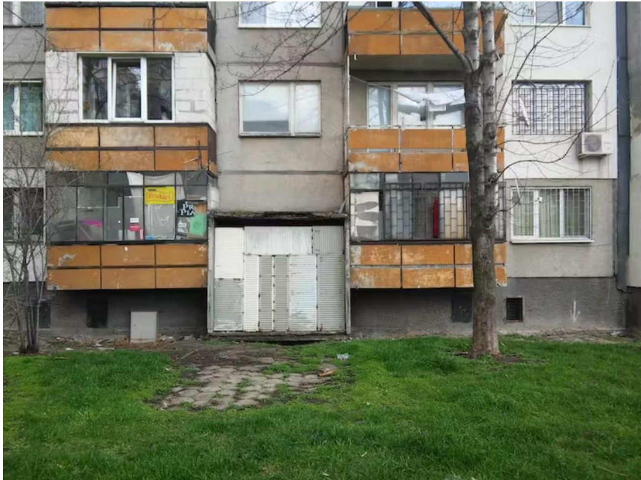
Zabite deskami wejście do bloku mieszkalnego z czasów socjalizmu w Sofii.