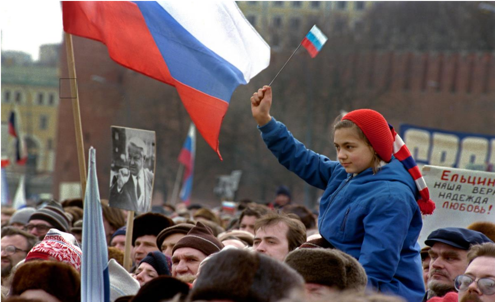
Rosja w okresie przejściowym lat 90. Tłumy gromadzą się na Placu Czerwonym w poparciu dla prezydenta Jelcyna, gdy parlament grozi mu impeachmentem.