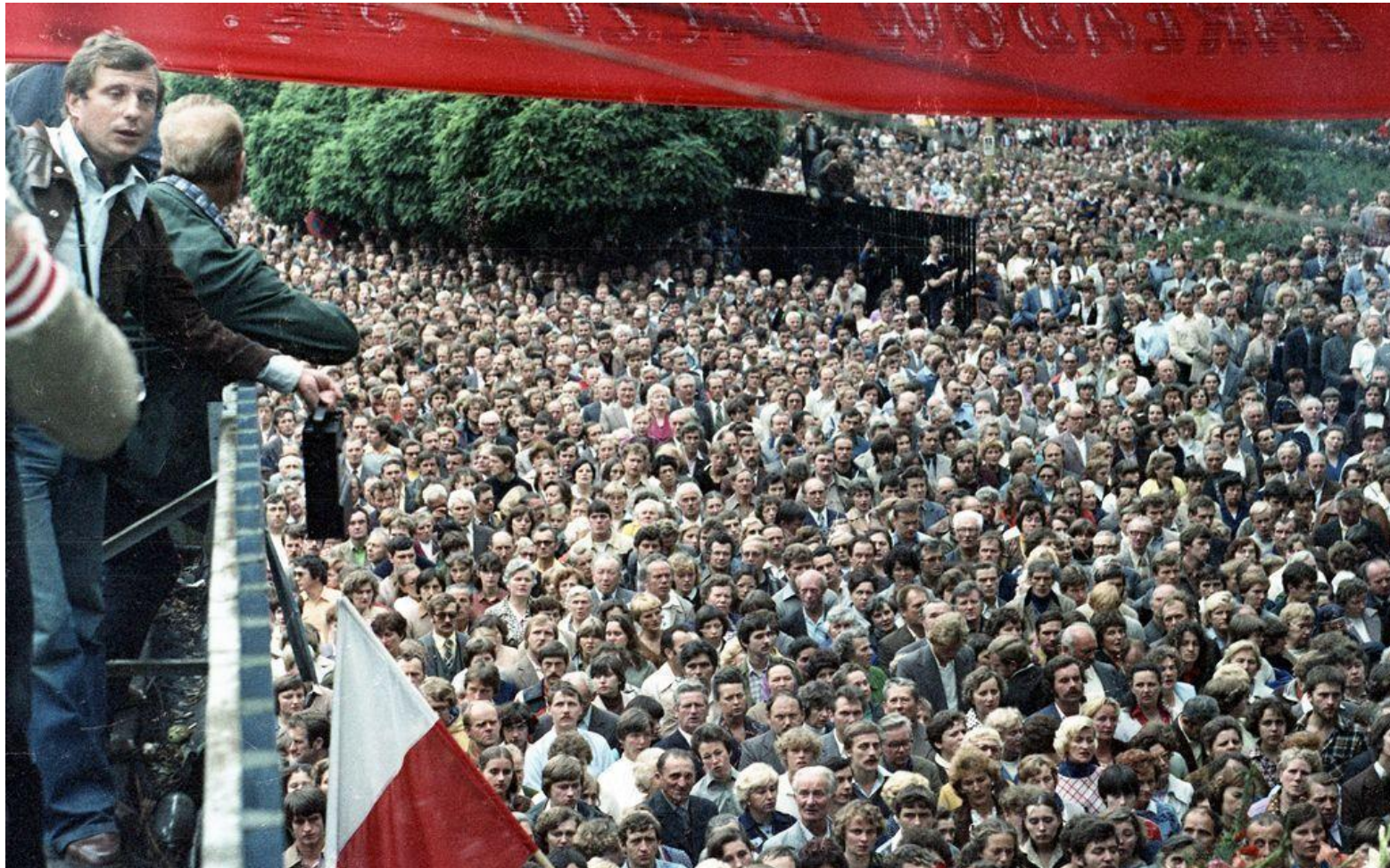
Uczestnicy strajku w Stoczni Gdańskiej im. Lenina w sierpniu 1980 roku.