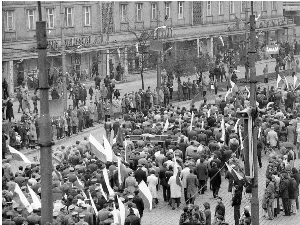
Polska - Obchody 1 maja we Wrocławiu.