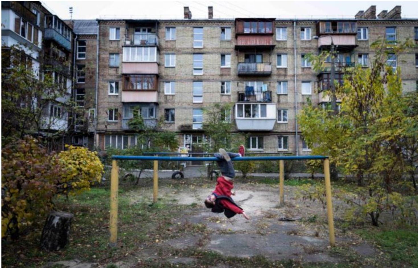
Chłopiec bawi się w podwórku budynku z czasów sowieckich na obrzeżach Kijowa, na Ukrainie.