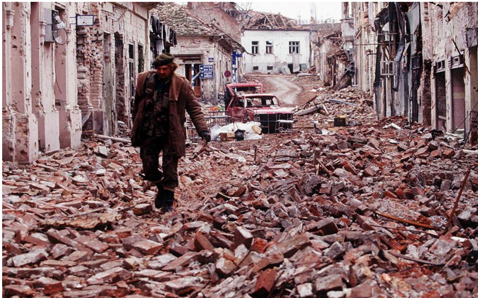
Vukovar, Chorwacja 1991 - brutalnie zniszczona przez agresję Serbów.