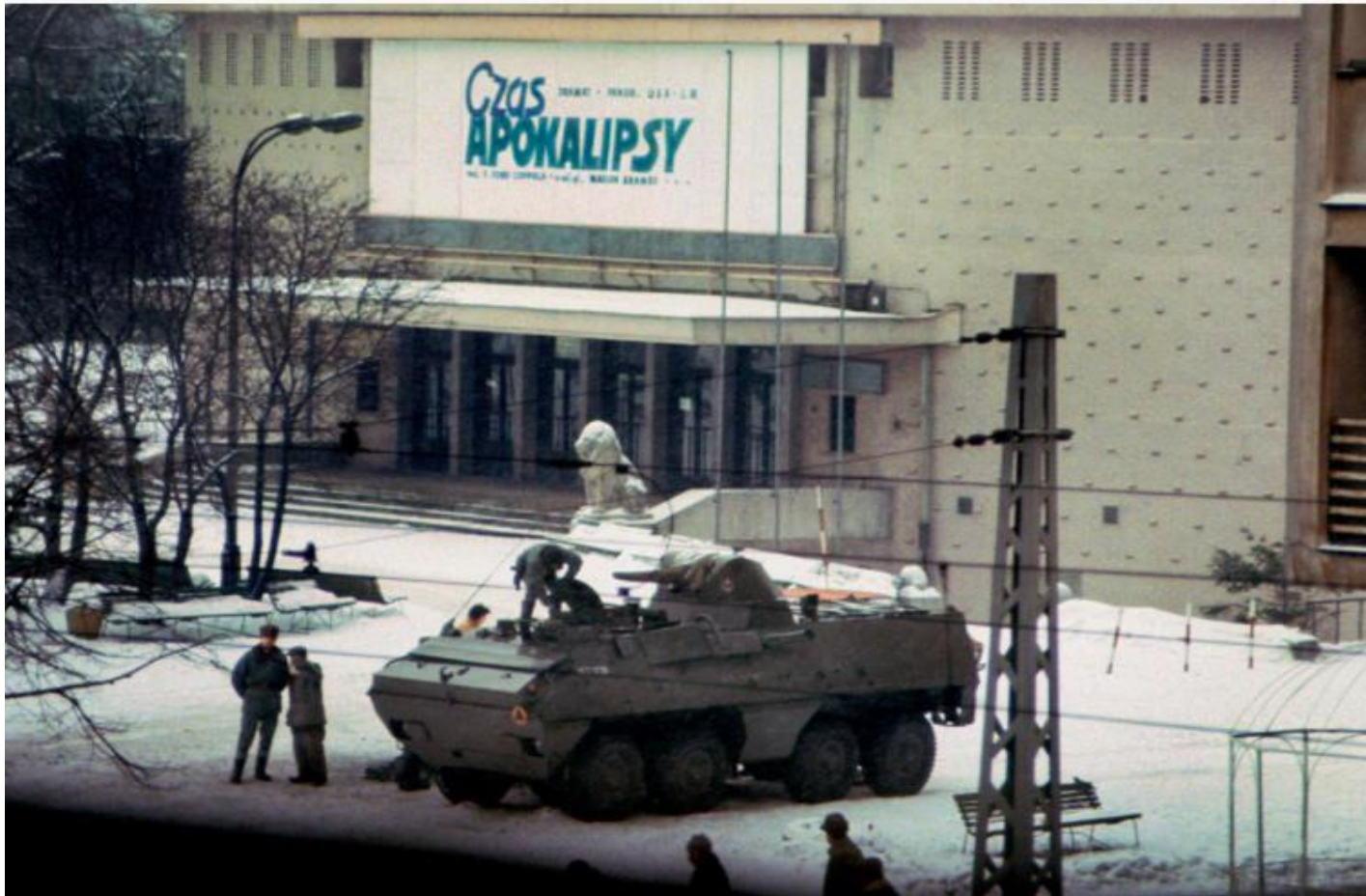
Chris Niedenthal, Warszawa, grudzień 1981 roku. Pierwszy dzień stanu wojennego. Kino "Moskwa" wyświetla film "Apokalipsa teraz" Francisa Forda Coppoli.